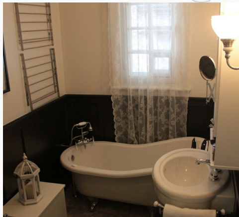
bains sur pieds, douche séparée, boiseries, cachet