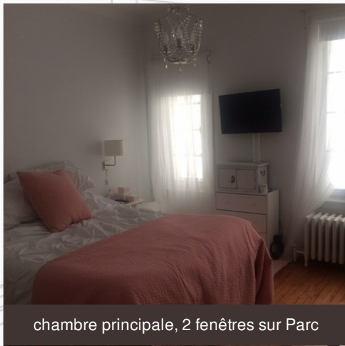
chambre principale, 2 fenêtres sur Parc